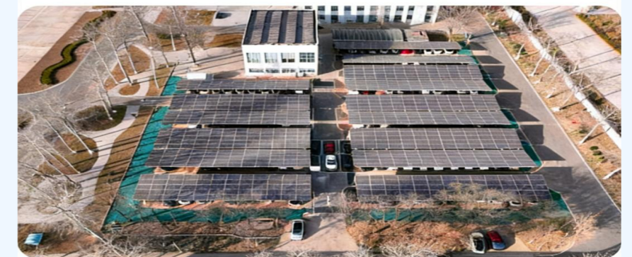
近日，石家庄炼化完成光伏车棚改造，正式并网发电。此次改造光伏安装容量为661.5千瓦，预计年发电量77万千瓦时。（本报讯）