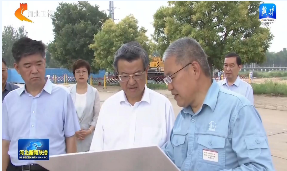
2025年8月7日，河北省委书记倪岳峰到企调研，河北省常委、石家庄市委书记张超超陪同。