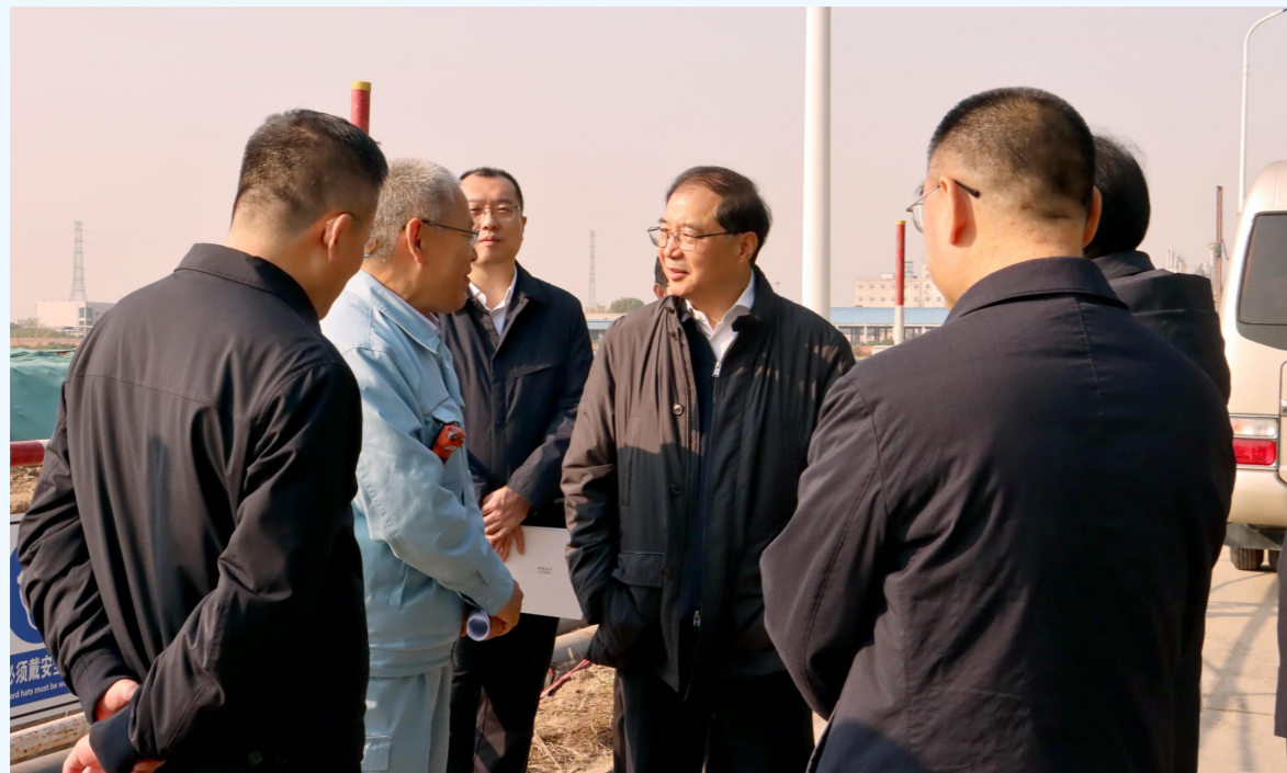
2025年11月3日，河北省副省长赵大春到企调研。